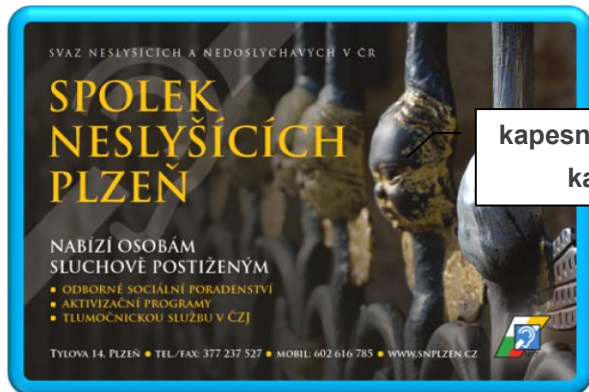
kapesní a nástěnný kalendář