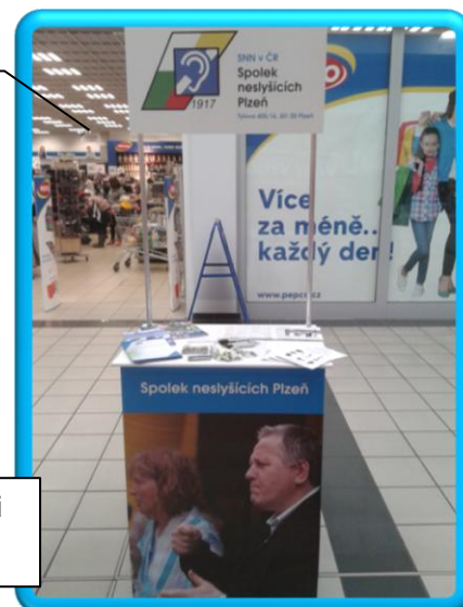
Konference ZČU v rámci projektu RoPoV