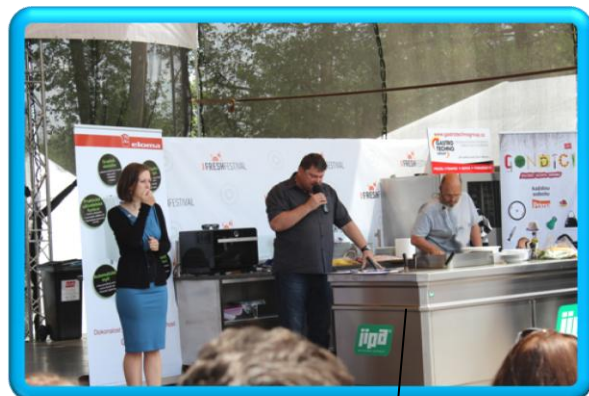
Prima Fresh festival Plzeň, Praha