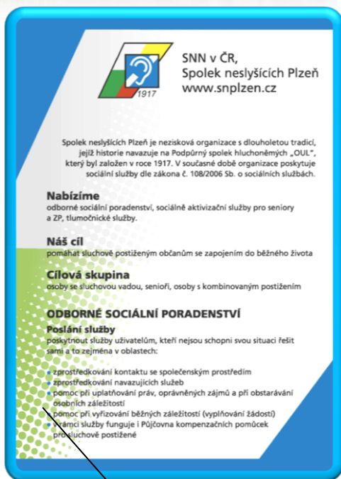
letáky (5x Dokážem se domluvit? a 1x o službách organizace)